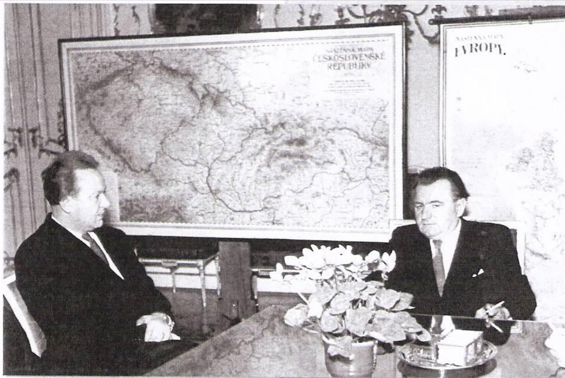
Protagonisté převzetí moci. Předseda KSČ a NF K. Gottwald (vpravo) a ministr A. Čepička, který v únorových dnech roku 1948 řídil tzv. akční výbory NF.

zastoupené v Národní frontě (NF). Pouze finální podobu KSČ od začátku plánovala plnou uzurpaci moci, předstírali, že z republiky se stane „most mezi Východem a Západem“ se socialismem.